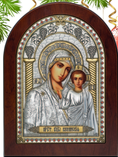
Икона Божией Матери Казанская