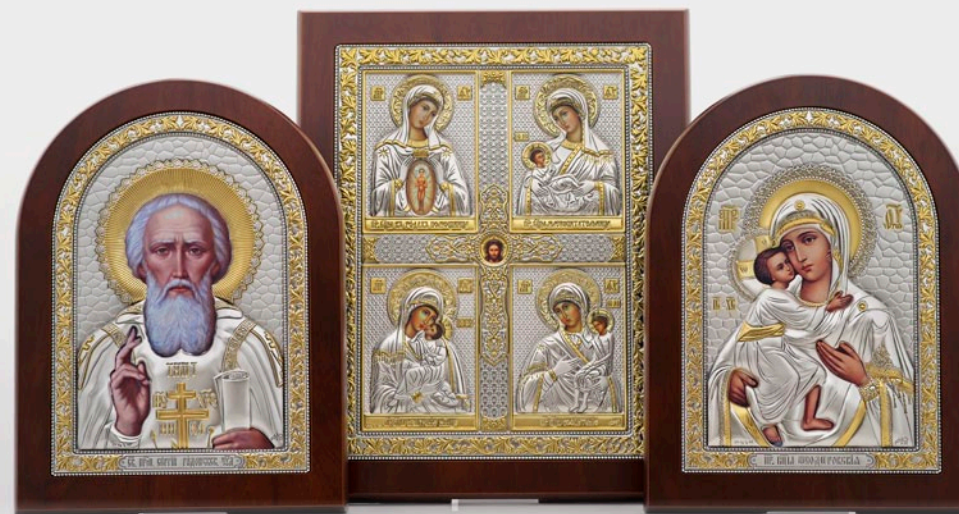
Икона прп. Сергия Радонежского

« Наши иконы являются образцом аккуратного и внимательного подхода к традициям. Мы используем в иконах полноразмерные (в размер всей серебряной ризы) изображения святых. Эти изображения производятся методом шелкографии. Лики святых многокрасочные, яркие и выполнены в академическом стиле