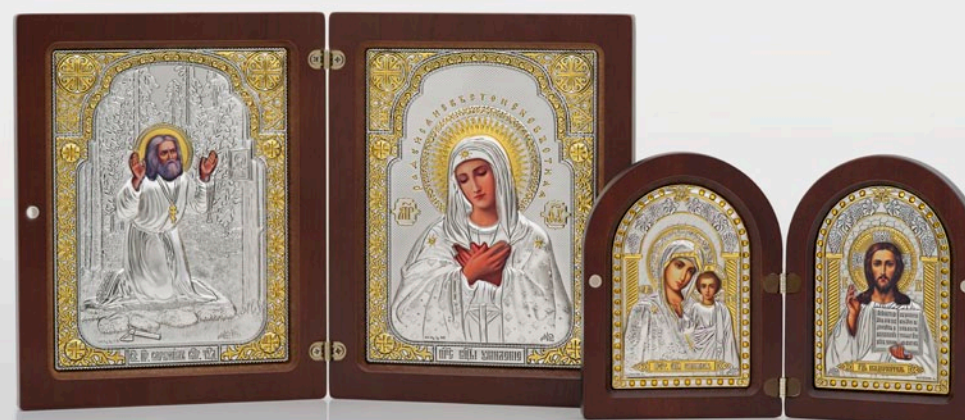
Большой складень с иконами: «Моление прп. Серафима Саровского на камне» и Божией Матери «Умиление»

Наша компания поставляет заказчикам иконы с окладами из биметалла, что является на сегодня наиболее приемлемым вариантом по соотношению «цена-качество». С одной стороны, существует четкое понимание, что с иконой из такого материала ничего не случится очень долгое время, так как слой листового серебра в биметаллическом листе относительно велик, поверхность покрыта толстым слоем прозрачного лака, благодаря чему не происходит потемнения иконы. С другой стороны, икона из биметалла стоит гораздо меньше, чем аналог из полновесного серебра.