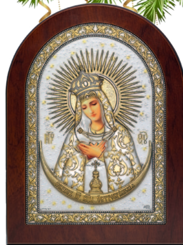
Икона Божией Матери Остробрамская

Сейчас в Россию поступает множество икон из материалов с непонятными для неспециалиста названиями «PVD» или «MIRO SILVER»**.